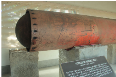
江間の地震動の擦痕

伊豆半島は大昔、太平洋の島だったが、プレートが動いて日本列島に衝突して、現在の伊豆半島ができた。