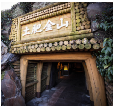
伊豆市の土肥金山