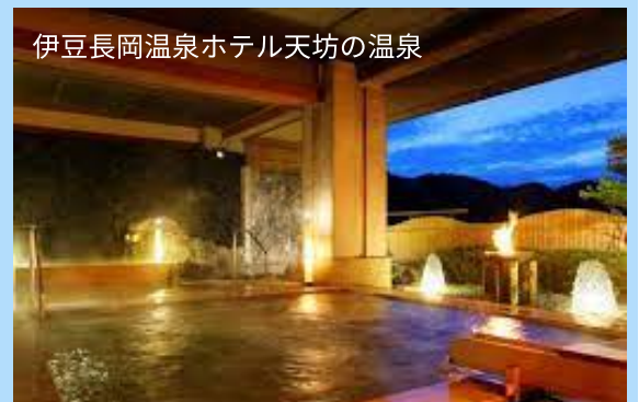
伊豆長岡温泉ホテル天坊の温泉

県内に源泉は約2500あります。その中の約2300は伊豆半島にあります。そして、源泉数はなんと全国3位です。これも、火山活動の影響です。伊豆長岡の温泉は、美肌や筋肉疲労に効果があります。温泉に入って心や体を癒やしてみてもはどうですか？