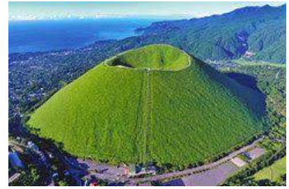
伊東市にある大室山

自然が豊かですごしやすい伊豆半島。大昔、伊豆半島は、日本列島に島がぶつかってできました。長岡で有名ないちごは、冬の天気に関わっていたり、温泉は、火山に関わっていたり、伊豆の魅力には、土地の成り立ちに関わっていることがわかりました。