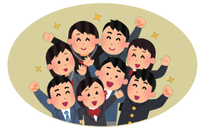
秋田県立湯沢翔北高校 総合ビジネス科のみなさん

オンライン開催。参加無料 お申し込みが必要です。 お申し込み・お問合せ先 伊豆半島ジオパーク推進協議会 電話 0558-72-0520 あるいは右記ページよりお申込ください