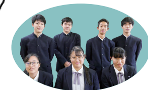
静岡県立沼津商業高校 情報ビジネス科のみなさん