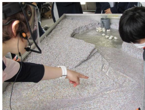
水理模型による 「川の流れによる地形の成り立ち」

今回特別に準備していただいた水理模型による「川の流れのしくみ」について生徒は大変興味を示し、小学生で学んだ「水のはたらき」である浸食、運搬、堆積について実験で見ることができ、河川周辺の地形がどのようにできるのか学ぶことができました。狩野川堤防は洪水などを防ぐための工夫がなされ、それによって私たちの日々の生活が守られていることが分かりました。また、9月ごろ予定している下田への宿泊学習に関連し、なぜ下田の龍宮窟はハートの形をしているのか、なぜ白浜海水浴場の砂は白いのか解説していただきました。ジオ学習をきっかけに伊豆に誇りを持っていただき、興味、関心が深まることを期待しています。