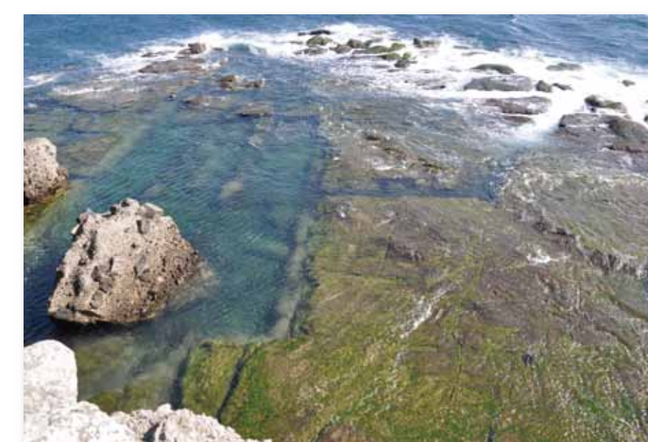
千畳敷に見られる石材を切り出した跡 The remnant of an old stone excavation site in Senjojiki.