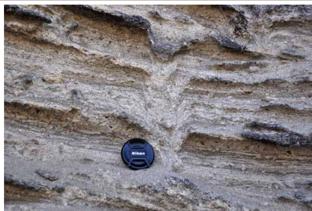
生物活動の化石 Trace Fossils

弁天島の地層が海でたまったことは、地層中に含まれる化石からわかります。こうした化石には、貝殻などの他に、生物が掘ったり這いまわったりしてできた「生痕化石」があります。 The strata in Bentenjima Island contain submarine fossils. You can find not only fossil shells but also "trace fossils" that are the holes and paths made by ancient marine lives.